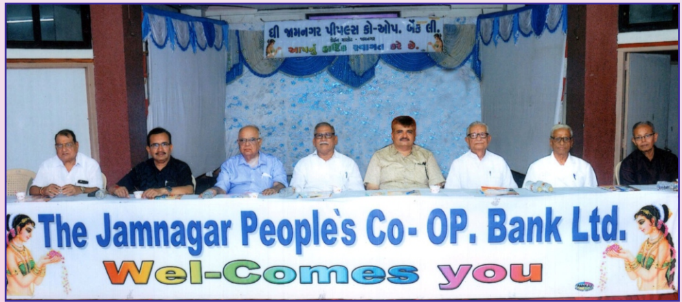
વર્ષ ૨૦૧૭-૨૦૧૮ની વાર્ષિક સાધારણ સભામાં બેંકના બોર્ડ ઓફ ડીરેક્ટરશ્રીઓ