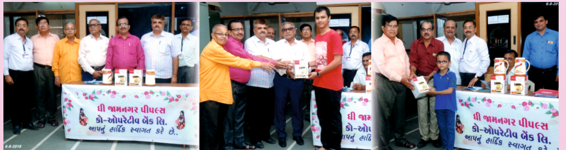
વર્ષ ૨૦૧૭-૧૮ વર્ષના સભાસહોના તેજસ્વી બાળકોને ઇનામ વિતરણ